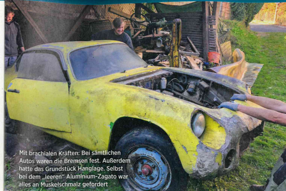
Mit brachialen Kräften: Bei sämtlichen Autos waren die Bremsen fest. Außerdem hatte das Grundstück Hanglage. Selbst bei dem „leeren“ Aluminium-Zagato war alles an Muskelschmalz gefordert

Nachbarn, nun zunehmend mutig geworden, spähen durch das offene Tor, betreten neugierig das früher rigoros abgeriegelte Refugium des Alten. „Hier durften wir nie rein.“ Mühsam und mit vereinter Kraft – der halbe Ort packt mit an – ziehen sie mit Seilwinden und Gurten Auto um Auto auf die Straße. Im abschüssigen Grundstück zum Teil kaum zu bewerkstelligen. Bei allen Autos sind die Scheibenbremsen fest. Und durch deren innenliegende Anordnung sowie die extrem eng zusammen- und teils an die Hauswände gepressten Fahrzeuge kommen die Männer kaum dran. „Irgendwann hatten wir keine andere Wahl, als die Autos mit Wagenhebern anzuheben, drunter zu kriechen und einfach die Antriebswellen durchzulenken. Teile hatten wir ja nun genug“, schüttelt Landau selbst den Kopf über das brutale Vorgehen. Trotzdem: Bei der Bergung einer Flaminia reißt das Seil auf halber Höhe zur Einfahrt, alle springen hinzu, um die Karosse vor dem sicheren Tod an der nächsten