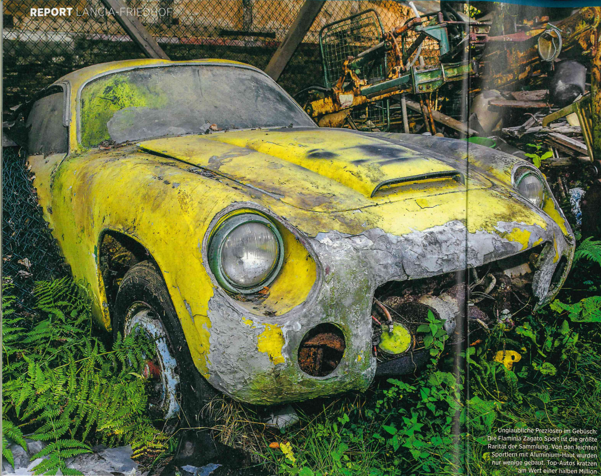
Unglaubliche Preziosen im Gebüsch: Die Flaminia Zagato Sport ist die größte Rarität der Sammlung. Von den leichten Sportlern mit Aluminium-Haut wurden nur wenige gebaut. Top-Autos kratzen am Wert einer halben Million