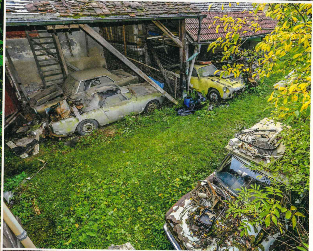
Vergleichsweise gut erhaltener, aber auch fast „alltäglicher“ Fund: frühes Fulvia-Coupé. Die Flavia-Limousine oben rechts im Garten ist bereits unrettbar ins Erdreich übergegangen