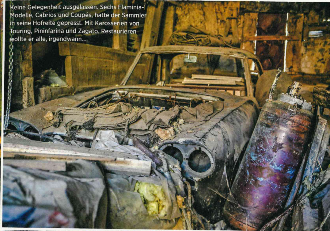
Keine Gelegenheit ausgelassen. Sechs Flaminia-Modelle, Cabrios und Coupés, hatte der Sammler in seine Hofreite gepresst. Mit Karosserien von Touring, Pininfarina und Zagato. Restaurieren wollte er alle, irgendwann...