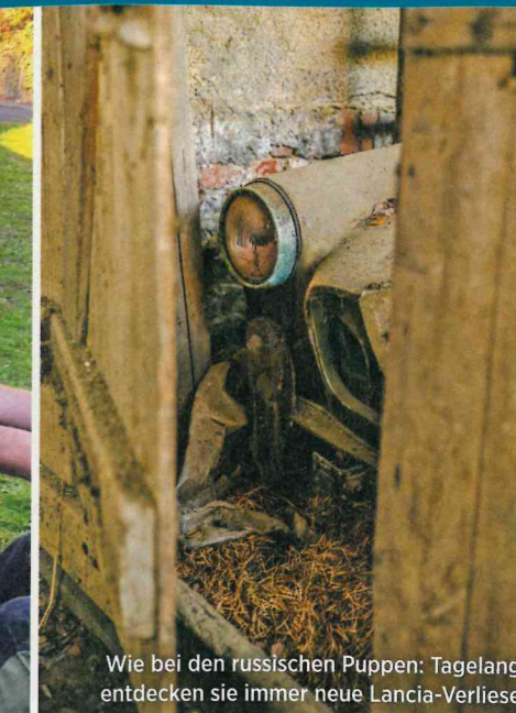
Wie bei den russischen Puppen: Tagelang entdecken sie immer neue Lancia-Verliese

Schuppenwand zu retten. Mit äußerster Kraft gelingt es ihnen. Gerade so.